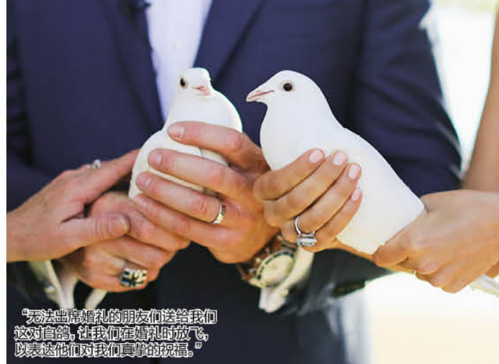
“无法出席婚礼的朋友们送给我们这对白鸽，让我们在婚礼时放飞，以表达他们对我们真挚的祝福。”